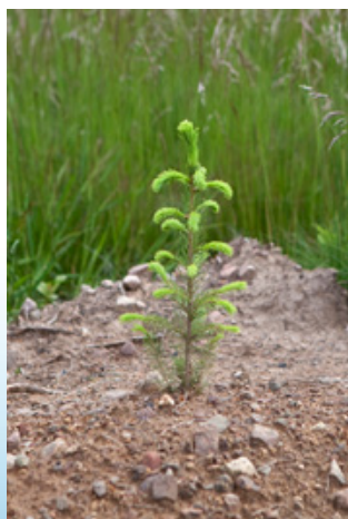
Med PI 1.a får man föryngringsresultat av högsta kvalitet och det med största möjliga biologiska hänsyn.