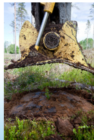
PI 1.a utför plantering på samma djup mitt i högen varje gång för bästa produktion och överlevnad.