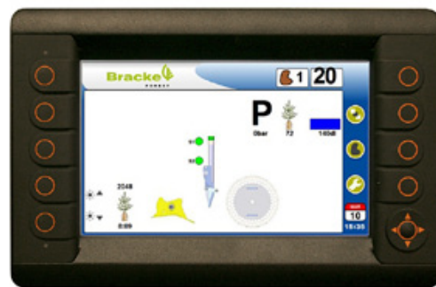
Bracke Growth Control är ett PLC-baserat styrsystem.