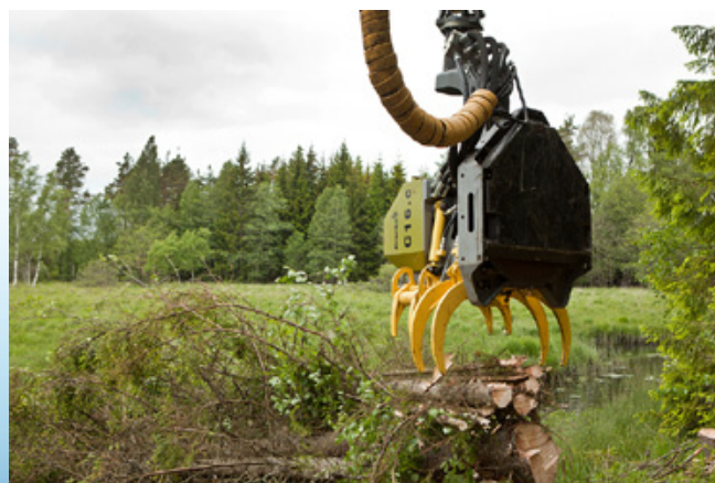
Tehokas metsänhoito yhdistettynä mahdollisuuteen kerätä biomassaa.