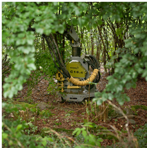
Bracke C16.c, keräävä bioenergiakoura metsänhoitotöihin ja energiapuun korjuuseen.