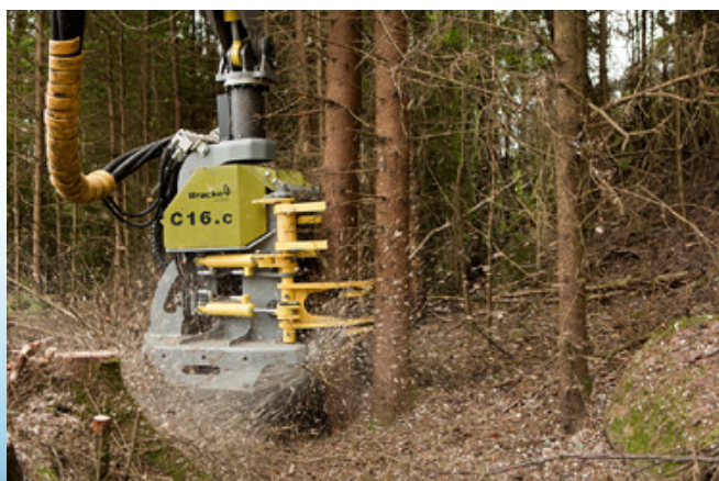
Ainutlaatuinen patentoitu katkaisujärjestelmä takaa suuren haku- kuukapasiteetin.