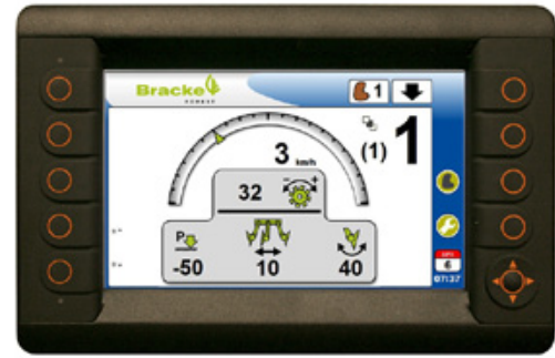
Bracke Growth Control on PLC-pohjainen ohjausjärjestelmä.