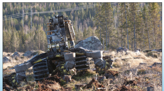
Bracke T35.b asennetaan suuriin metsäkoneisiin.