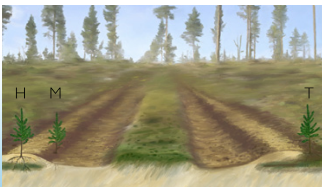
Bracke T35.b muodostaa istutuspaikat kaksinkerroin käännettystä kunnasta (T), kaksinkerroin käännettystä kunnasta ja kivennäismaasta (H) tai kivennäismaasta (M).