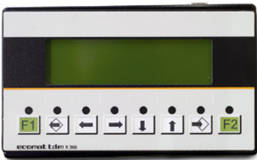
PLC-pohjainen, CAN-bus-tekniikkaa käyttävä Bracke Growth Control -ohjausjärjestelmä