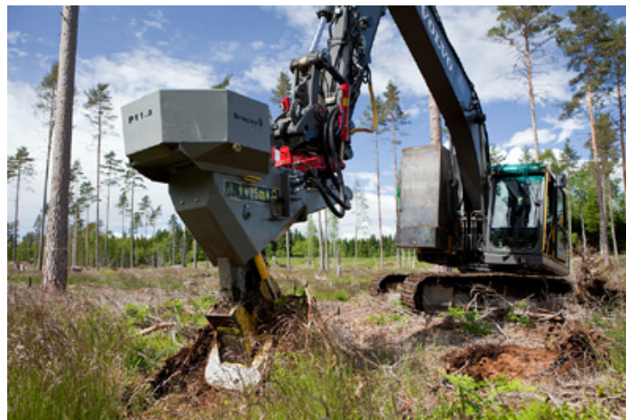
Le P11.a effectue le conditionnement du sol et la plantation.