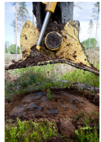
Le P11.a effectue chaque fois la plantation à la même profondeur, au milieu de la motte, pour une meilleure production et pour la survie.