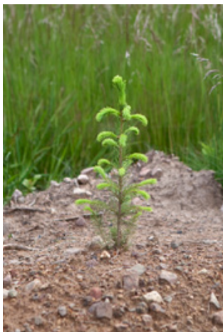
Le P11.a permet d'obtenir des résultats de régénération de la plus haute qualité et dans le plus grand respect de l'écologie.