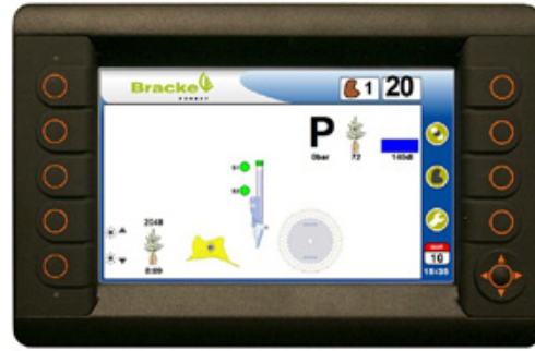
Le système de commande Bracke Growth Control est basé sur PLC.