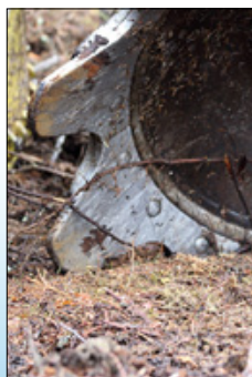
Les dents des disques sont remplaçables.