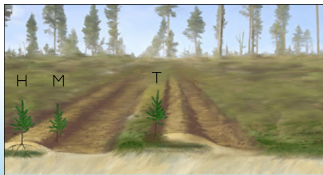
Le Bracke T28.b forme des microsites de plantation d'humus retourné (T), de sol minéral sur humus retourné (H) et de sol minéral sur sol minéral (M).