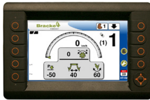
Display för inställningar och kontroll av harven.