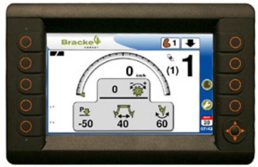
PLC-pohjainen, CAN-bus-tekniikkaa käyttävä Bracke Growth Control -ohjaujärjestelmä