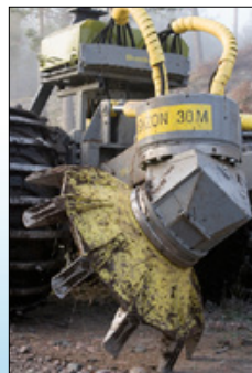
Muokauslautaset vaihdettavilla hampailla.