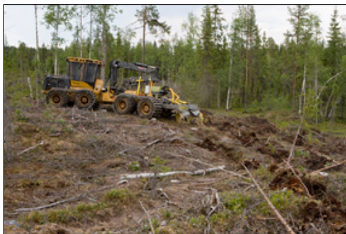
Le Bracke T26.b peut se monter sur un engin porteur de taille moyenne ou de grande taille.