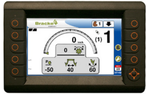
Le système de commande Growth Control est basé sur un système de commande PLC.