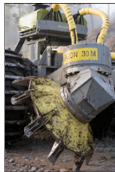
Les dents des disques sont remplaçables.