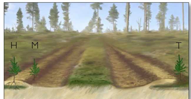
Le Bracke T26.b forme des microsites de plantation d'humus retourné (T), de sol minéral sur humus retourné (H) et de sol minéral sur sol minéral (M).