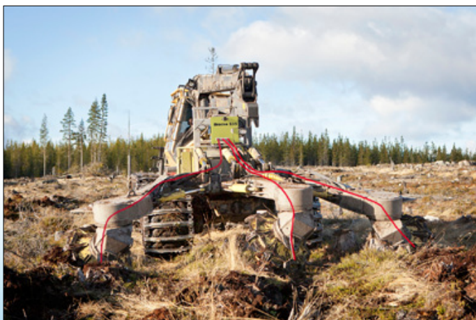
Bracke S35.a kan monteras på en-, två- och tredriga markberedningsaggregat.