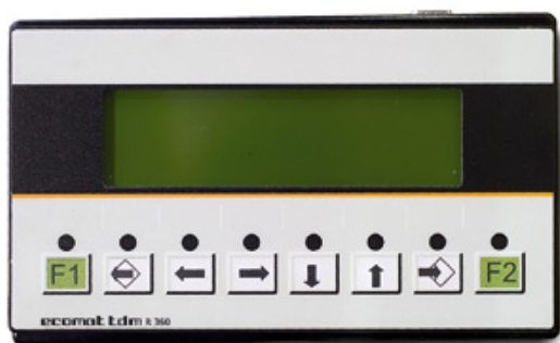
Bracke Growth Control är ett PLC-baserat styrsystem.