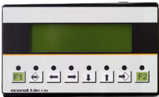
Bracke Growth Control - это система управления, основанная на программируемом логическом контроллере PLC.