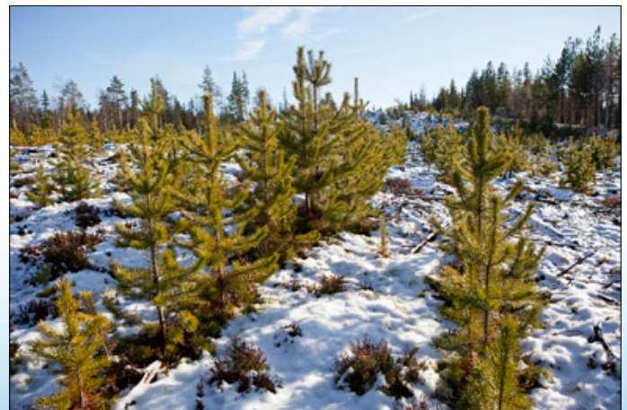
При использовании агрегата S35.a для подготовки почвы и посева достигается очень высокое качество получаемого древостоя.